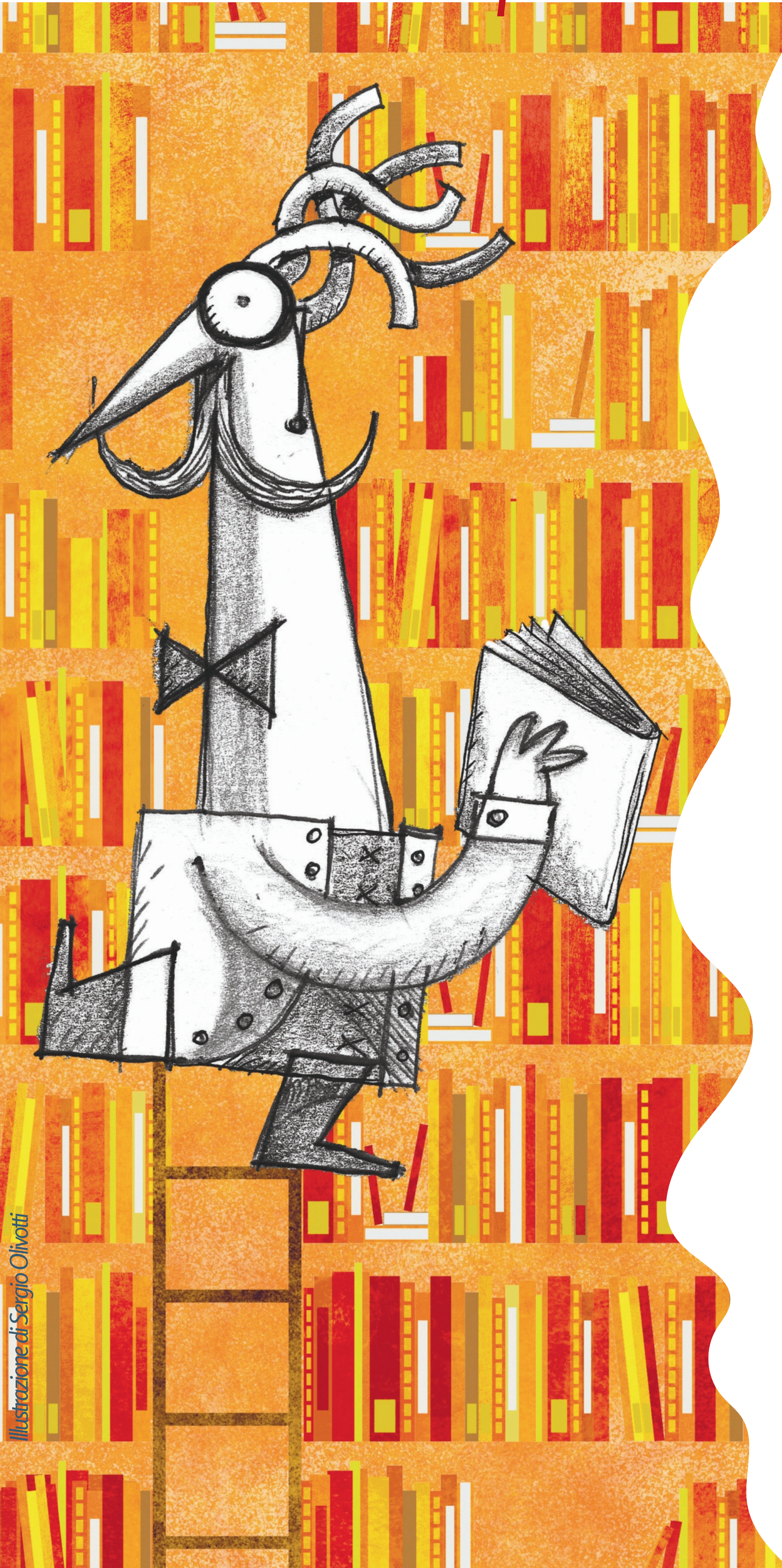
Illustrazione di Sergio Olivotti